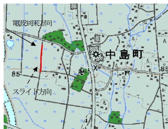
図 2 スライド調査場所例