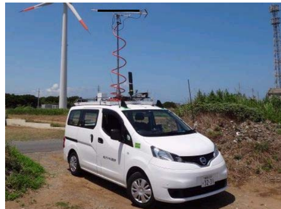
図 1 電界強度測定車

記録した事例を図 3 に示します。 横軸は測定車の走行に合わせ記録紙 を送ったパラメータ「距離」で、 縦軸は測定した電界強度値です。 図中の赤色で示したように全移動距離 に対して半分の距離に当たる縦軸の電 界強度が場所率 50% 値です。