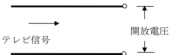
図1 終端電圧と開放電圧

“電界強度”とは、ラジオ、FM、テレビ放送を含む全ての電波の強さを表すもので、その位置は“空間”です。“電界強度”の定義は次のようになります。